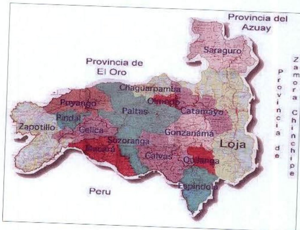
Ilustración 2. Mapa Político del Cantón Loja.

Norte: Con el cantón Saraguro, Sur y Este: Con la Provincia de Zamora Chinchipe Oeste: parte de la Provincia de El Oro y los cantones Catamayo, Gonzanamá y Quilanga.